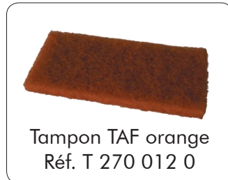
Tampon TAF orange Réf. T 270 012 0

- Fibre douce polyester pour lustrer : carrelages, terre cuite, pierres, marbre, plastiques, parquets, chromes, etc... - Également très efficace pour nettoyer les surfaces émaillées.