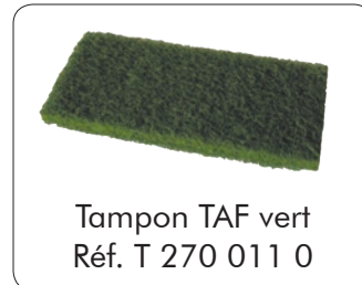
Tampon TAF vert Réf. T 270 011 0

- Fibre demi-douce polyester pour frotter : idéal pour étaler la cire en pâte sur carrelages, pierres, dalles, etc... - Très efficace pour nettoyer les carrelages émaillés, terrasses, etc...