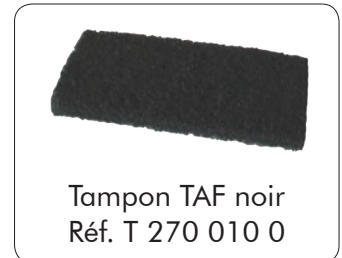
Tampon TAF noir Réf. T 270 010 0

- Fibre nylon abrasive pour nettoyer les joints de carrelages au sol, dallages, terrasses, terre cuite, etc... - Très efficace pour raviver et nettoyer les briques, barbecues et grilles, etc...