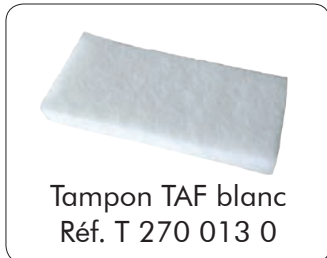
Tampon TAF blanc Réf. T 270 013 0

- Fibre douce polyester pour lustrer : carrelages, terre cuite, pierres, marbre, plastiques, parquets, chromes, etc... - Également très efficace pour nettoyer les surfaces émaillées.