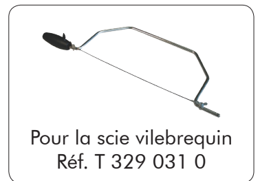
Pour la scie vilebrequin Réf. T 329 031 0

Après une longue utilisation, il est recommandé d'inverser la lame de scie (effet d'auto-affûtage).